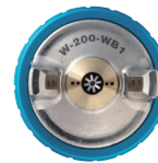
W-200 WB BUSE À AILETTES