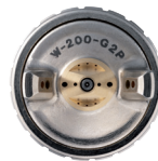
W-200 BUSE STANDARD